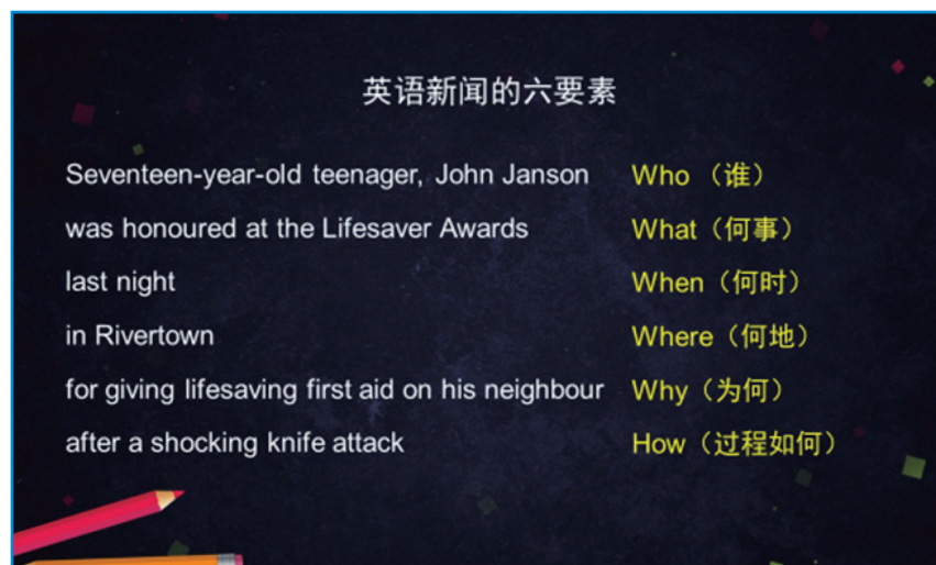
图2. 英语新闻的六要素

教师给学生展示一则新闻标题“China, Germany show the way to mutually beneficial cooperation”。根据语境,教师启发学生思考新闻标题中逗号的含义,即“and”。随后,教师