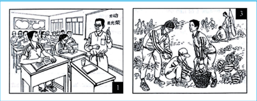
图 4. 作文图片

《普通高中英语课程标准（2017年版）解读》强调，语言运用不仅仅需要传统上的语言本体知识作为基础，还需要运用性知识，即语篇知识和语用知识，来盘活语音、词汇和语法知识（梅德明、王蔷，2018）。此写作任务改编自2019年高考英语北京卷情景作文，旨在检测教学效果，同时给学生提供运用新闻语篇知识、融入语言知识、调动语言技能与策略得体表达自己的机会，把阅读向写作再推进一步，推动英语语言能力的发展。